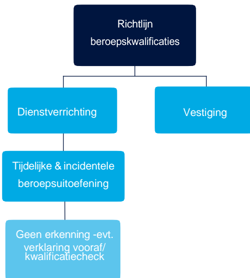
Figuur 1: Richtlijn beroepskwalificaties, regime dienstverrichting

Om de structuur van de richtlijn beroepskwalificaties inzichtelijk te maken, wordt in deze gids gewerkt met een stroomschema. Het regime voor dienstverrichting is één deel van het schema.